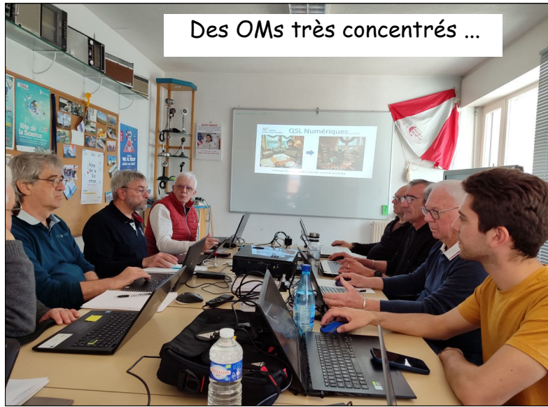
Des OMs très concentrés ...