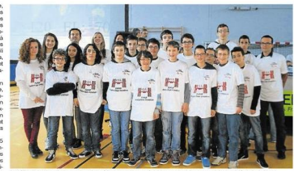
Les élèves du club d'astronomie ont posé leurs questions préalablement traduites en anglais et validées par la Nasa.